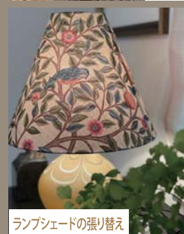
ランプシェードの張り替え