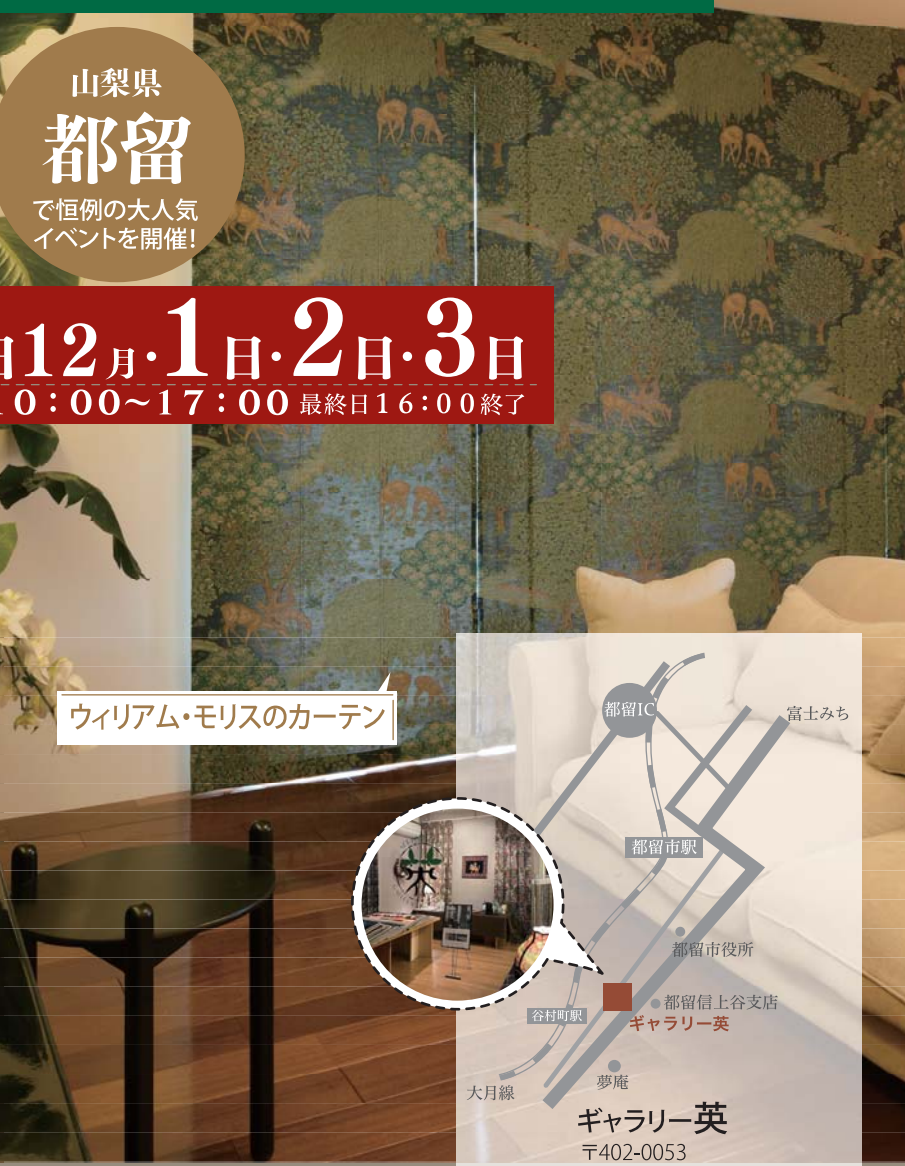
ウィリアム・モリスのカーテン